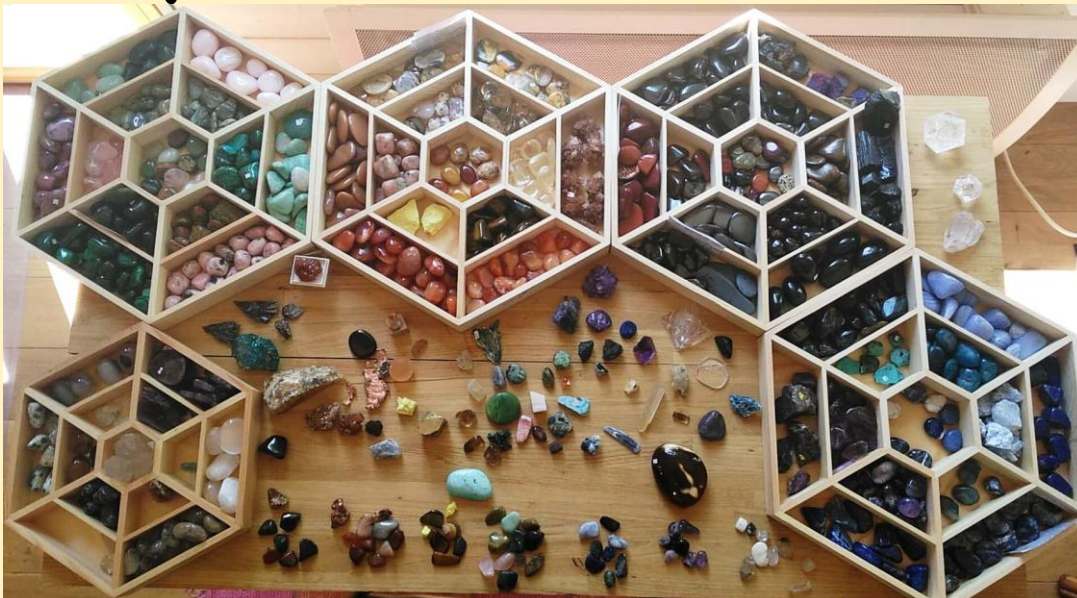
Table de jeu d'un soir :